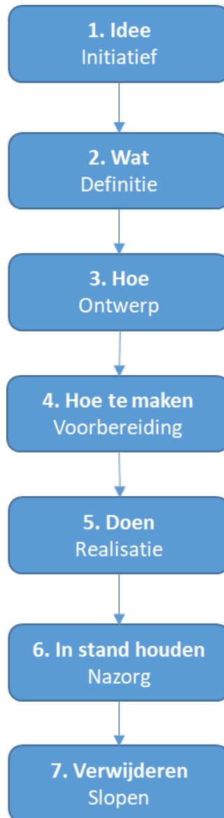
Figuur 1 Projectrealisatie keten

Van idee tot en met uitvoering, nazorg en sloop kent een project de volgende projectrealisatie keten (zie figuur 1).